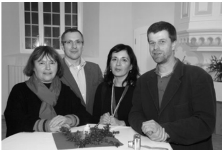
Members of the Jury (left to right):

The film tells the story of a young woman finding self-confidence after the death of her husband. In carefully arranged shots the director develops a modern fairy tale about a woman who defends her independence against the expectations of others. The poetic strength of the main character lends significance to the film beyond specific circumstances.