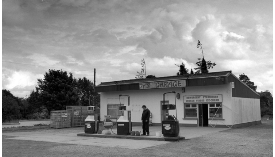
Commendation: Garage by Lenny Abrahamson

The general spirit of the festival in its first feature films as well as in the classical ones (like those of Lynch, Cronenberg etc.) has been a profound reflection on human condition in the contemporary world, with more questions than answers, more problems than solutions in a significant horizon of myths and symbols.