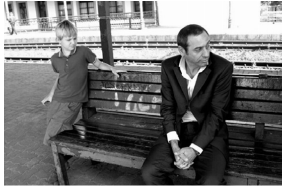
Tricks von Andrzej Jakimowski

Als besten Film des Festivals zeichnete die Ökumenische Jury Reise mit Haustieren (Travelling with Pets) (Russland 2007) aus. Die junge Natalja lebt in einem auffälligen Bahnhof mit ihrem viel älteren, ungeliebten Ehemann. Dessen plötzlicher Tod bietet ihr die Chance, selbst Entscheidungen für sich zu treffen. Wera Storoschewas Film zeigt die ungewöhnliche Emanzipationsgeschichte einer jungen Frau, die sich im Nirgendwo der russischen Provinz die Welt neu aneignet. Die Moskauer Theaterschauspielerin Xenia Kutepova bietet eine überragende Darstellung in den klug komponierten Tableaus der russischen Regisseurin.