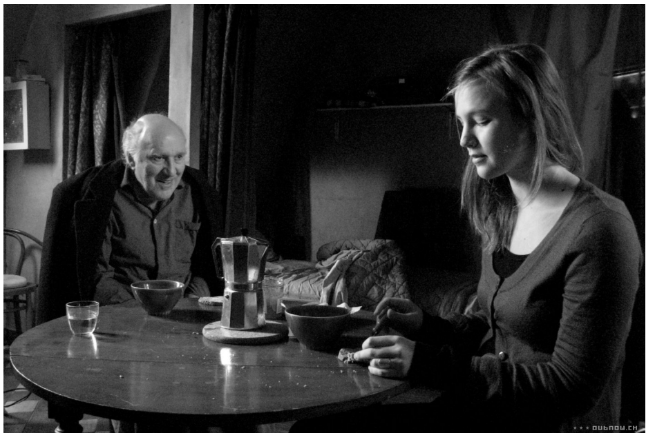
Sous les toits de Paris

Last year, when the festival was initially launched, it proved to be such a success that 400 guests immediately applied for accreditation to this year's event. Not surprising – for its president is actress Inna Churikova, the doyenne of Russian stage and screen. And a fully restored version of Tarkovsky's Andrei Rublev (USSR, 1969) was billed as one of the festival's key attractions. But the real reason for the festival's success is the splurge of multiplexes scattered across Russia. Ivanovo, together with neighboring Pilos and Yurievets, can boast of eight cinema halls, offering 100 screenings to circa 15,000 spectators. Altogether, 130 films were