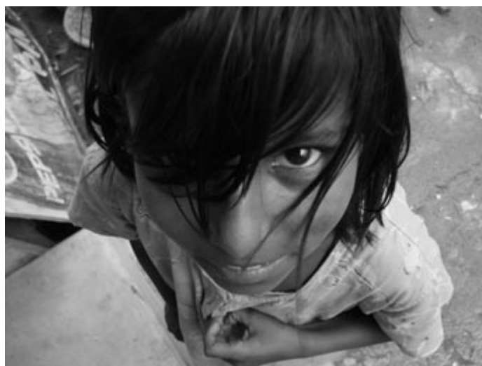
Setu (The Bridge)