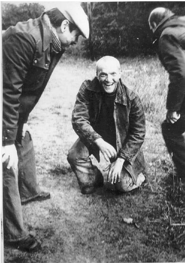
Andrej Tarkovsky (left) and Alexandr Kaidanovsky at the shooting of „Stalker”