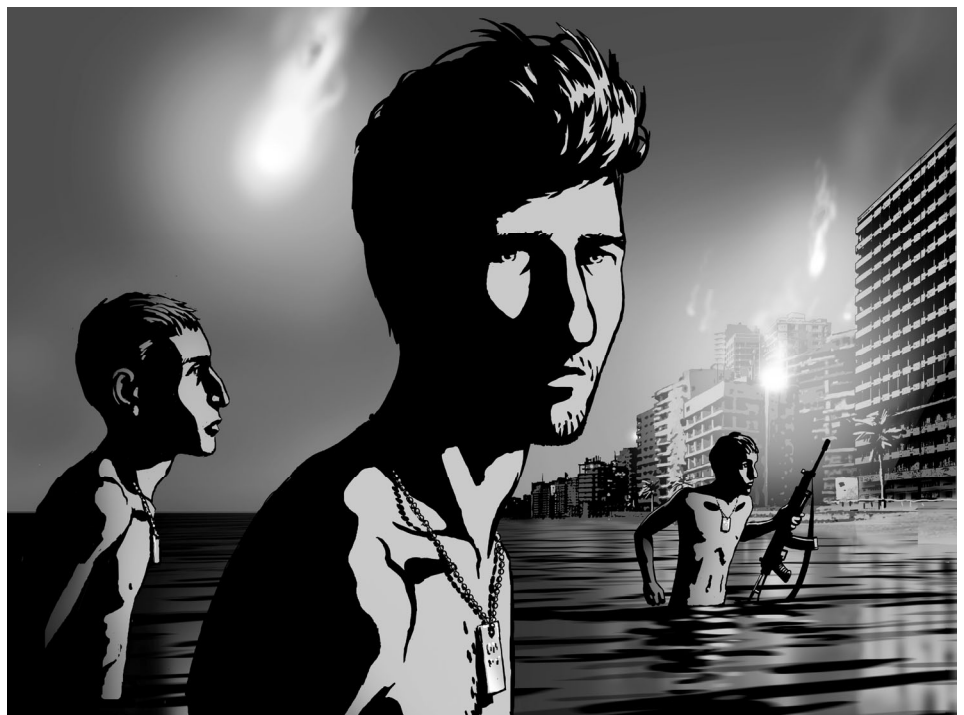
Waltz With Bashir

In my view, two additional competition films deserve comment. Waltz with Bashir (directed by Ari Folman) opened to rave reviews at the festival but didn't receive a prize. An innovative documentary, this series of interviews was transposed into animation to allow the visual representation of memory, visions, and dreams reported by Israeli men who fought in the 1982 Lebanon war. The director was part of this offensive, and began to explore his complete loss of memory about the