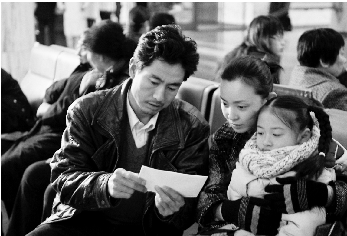
In Love We Trust

The annual Ecumenical Reception of the Churches honoured the contribution of the Ecumenical Jury over the years to reward films that raise human fundamental questions. Placing his speech in the context of the Bundestag's discussions of the Film Promotion Act, Bishop Dr. Wolfgang Huber, Chairman of the Council of the Evangelical Church in Germany, concluded on the role of cinema: „Beyond their entertainment value, cinema movies need an added value, a message that makes us set out – initially for the cinema, but then also on an onward journey. Films have only a long-lasting effect when they do not lead us away from ourselves, but into our innermost being.” I left the Berlinale in the hope that the films that our jury had rewarded would inspire such a journey.